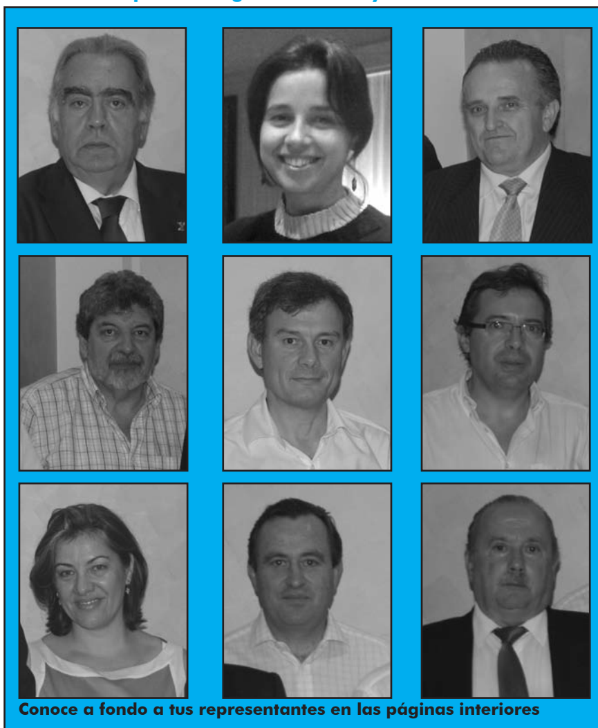
Conoce a fondo a tus representantes en las páginas interiores

El próximo día 4 de enero, a partir de las 11 de la mañana, el Colegio abre sus puertas para los hijos de colegiados que quieran venir a pasar un buen rato en la sede colegial. Se proyectará una película infantil, habrá actuaciones, refrescos... ¡y todo aquel que traiga un dibujo se llevará un regalo a casa!. Pen-