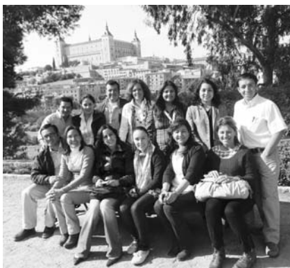
La vocal de AP acompañó a los residentes de Guadalajara