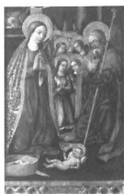
«NAVIDAD» Natividad de Jesús. Óleo sobre tabla realizado por el Maestro de Artes, Principios del siglo XVI. Museu de Belles Arts de València.