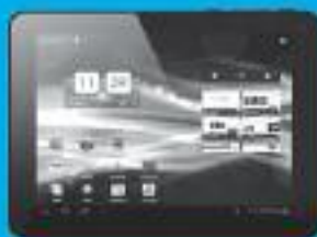
Tablet 8" UNOTEC TROY II