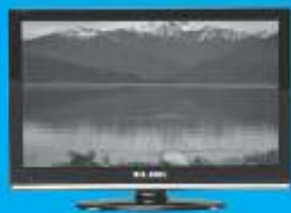
Televisor 19" LED Elbe

Y para empezar, aproveche esta atractiva oferta de bienvenida*: sólo por domiciliar su nómina en Deutsche Bank podrá elegir entre: