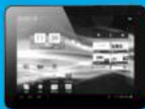
Tablet 8" UNOTEC TROY II