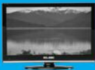
Televisor 19" LED Elite

Y para empezar, aproveche esta atractiva oferta de bienvenida*: sólo por domiciliar su nómina en Deutsche Bank podrá elegir entre: