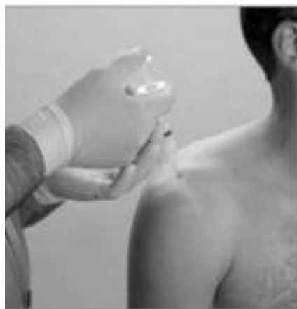
INFILTRACIÓN TRICOMPARTIMENTAL: VÍA TRANSACROMIAL

Como toda técnica requiere una formación y entrenamiento que son relativamente sencillos en muchos