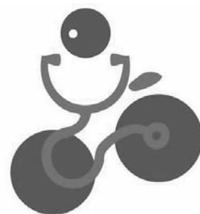
II Campeonato de España de Ciclismo Colegios de Médicos

El Colegio de Médicos de Bizkaia, organiza el 17 de Septiembre de 2011 en Bilbao el "II Campeonato de España de Ciclismo de Colegios de Médicos". Una cita a la que están invitados todos los Colegios de Médicos de España, 52 en total. Un campeonato dirigido exclusivamente a equipos de Colegios de Médicos y que para su ejecución contará con la colaboración del Club Ciclista Erandioko Txirrindulari Elkartea.