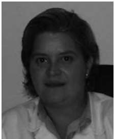
Por MAR SÁNCHEZ FERNÁNDEZ

Este programa, pionero en Europa, dispone de unos procedimientos colegiales y de una unidad asistencial, con servicio de internamiento, de hospital de día y de tratamiento ambulatorio, espaciadas y confidenciales.