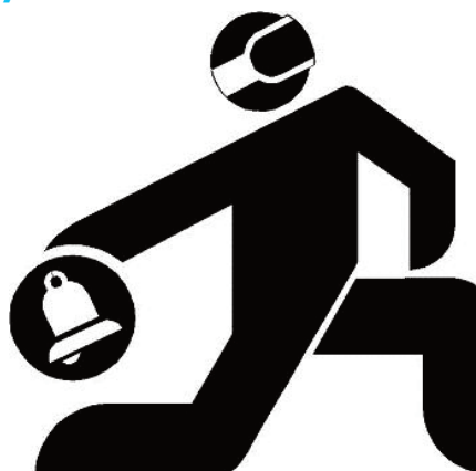
El Goalball es un deporte para invidentes

Con el objetivo de concienciar a la sociedad sobre los problemas que acarrearán las discapacidades visuales y cómo se enfrentan a ellos los afectados, la ONCE organiza la XXI Semana de la ONCE en Guadalajara. Entre las actividades programadas, Guadalajara contará con exposiciones en la Delegación de la Junta en Guadalajara bajo el nombre De la pauta y el punzón al braille computerizado y La labor de la ONCE en el Sáhara . Están orientados a los escolares y al público en general. Para los más pequeños habrá talleres de Goalball (un deporte exclusivo para ciegos) y un circuito de movilidad con bastón. Además se realizarán revisiones oftalmológicas a los ciudadanos de Guadalajara, todo ello en la plaza del Jardinillo. Los interesados podrán participar en un taller de iniciación al Braille en la Delegación de la Junta. También habrá una actuación del grupo